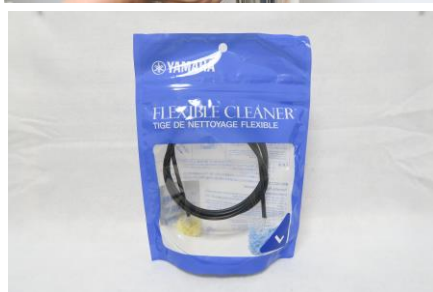
フレキシブルクリーナーL

1 番ピストンを抜いておきます フレキシブルクリーナーの先にアルコールをつけマウスパイプに通します *フレキシブルクリーナーのブラシ部分は取れやすいので 通す作業はゆっくり行ってください